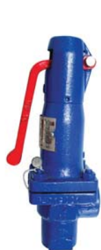
Válvula de segurança