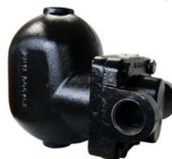
Purgadores de bóia