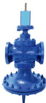
Válvulas redutoras de pressão