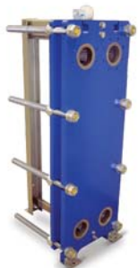
Trocadores de calor a placas