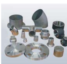
Conexões de inox