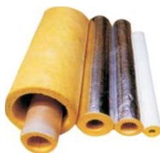
Calhas de lã de vidro e lã de rocha