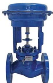
Válvulas controladoras de temperatura