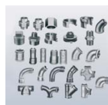
Conexões galvanizadas e em aço carbono