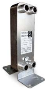
Trocadores de calor brasados