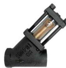
Visores de fluxo