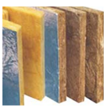
Manta de lã de vidro e lã de rocha